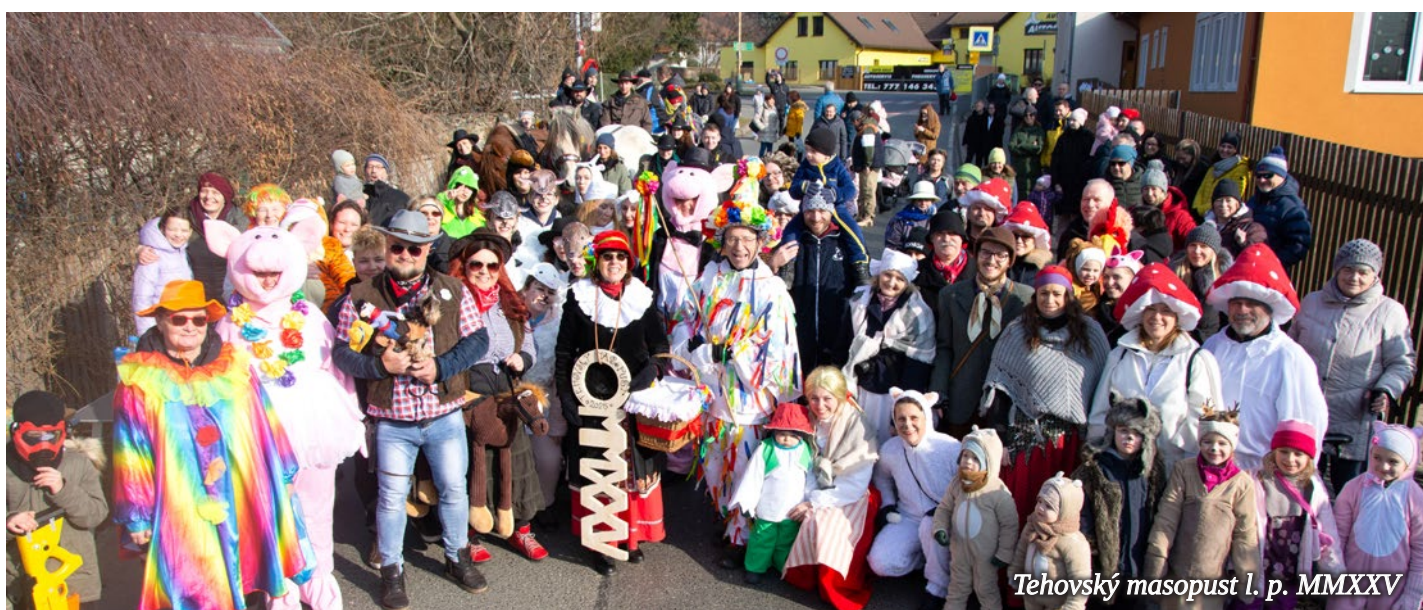
Tehovský masopust 1. p. MMXXV