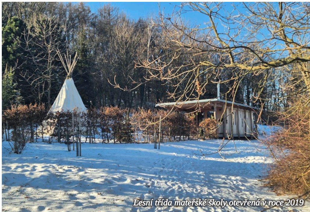
Lesní třída mateřské školy otevřená v roce 2019